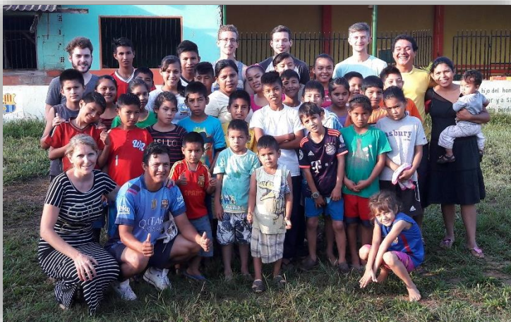
Foto del hogar en mayo 2017

Queremos agradecer a todos que nos apoyaron para los vuelos; ya nos falta solo un poquito y podremos cancelar todo. Dios mediante llegaremos el día 26 de enero con Swiss LX 93 a las 11:00 a.m. en Zürich.